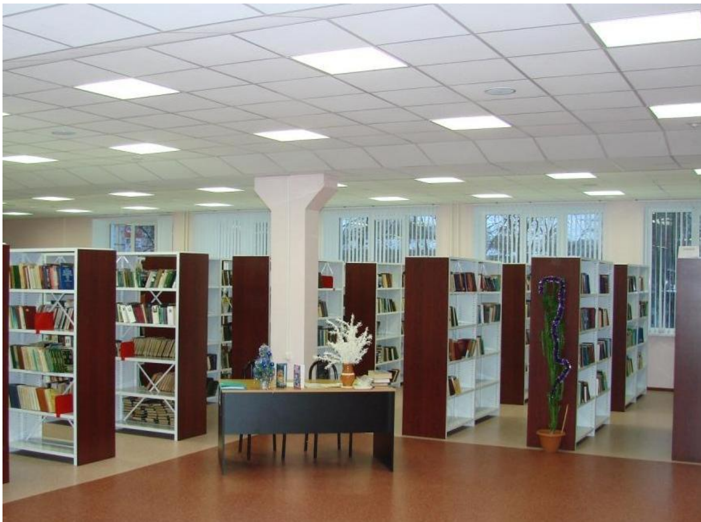
Фото 9. Металлические стационарные стеллажи в библиотеке (Серия «СА» с лицевыми стенками из ЛДСП)