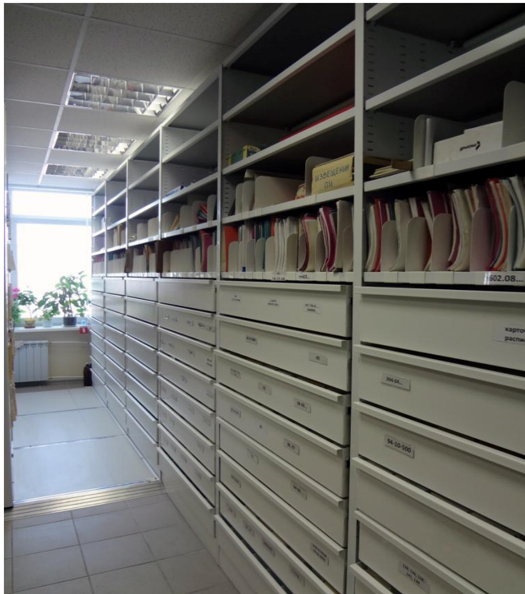
Фото 4 . Комбинированная конструкция. Нижняя часть секций стеллажа укомплектована выдвижными ящиками со специальными габаритами, вверху – полки с разделителями папок. Серия «СА».