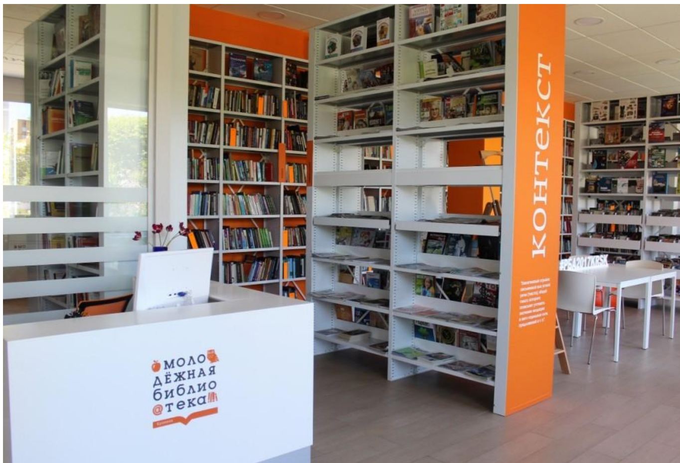
Фото 10. Боковые дизайн – панели библиотечных стеллажей оклеены специальной пленкой.