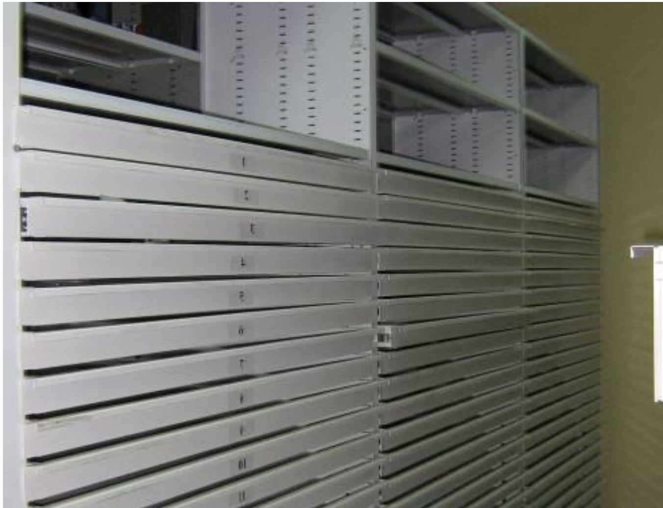
Фото 5. Комбинированная стеллажная конструкция: в верхней части стеллажных секций полочные уровни хранения под формат А4, в нижней части – выдвижные ящики под хранение рисунков и эстампов. Серия «Л».