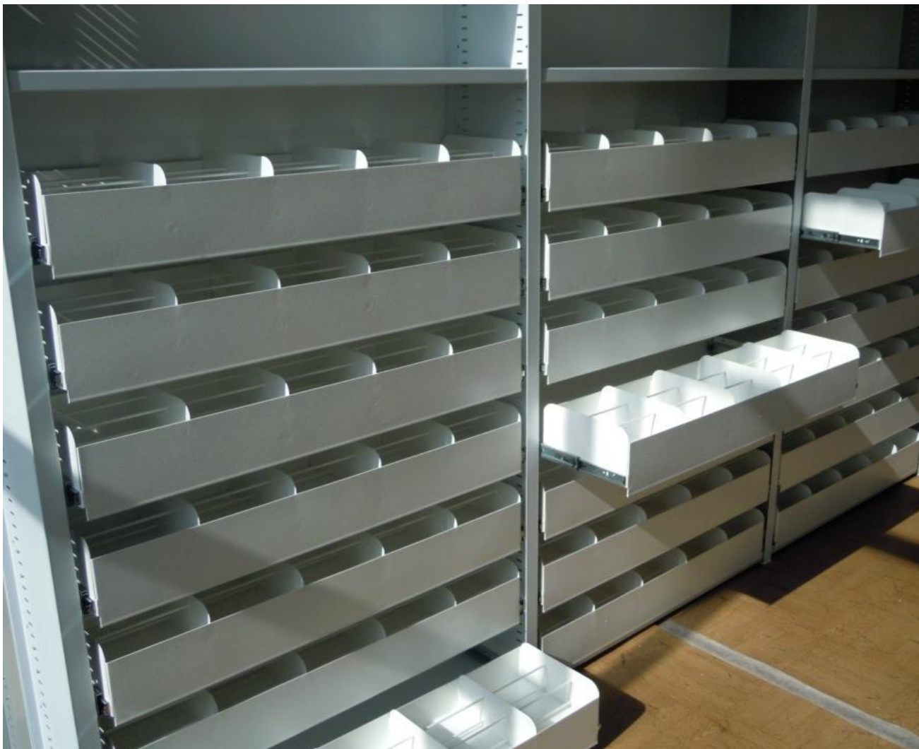
Фото 6. Секции стеллажей с выдвижными ящиками для хранения CD – дисков, картотеки.