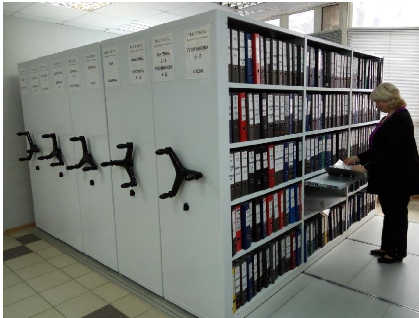
Фото 3 . Передвижные стеллажи с фальшполом. Серия «Л». Удобство и безопасность работы – фальшпол образует одну поверхность с рельсами. Возможность установки системы стеллажей на неровные полы. Просмотр хранимых документов на выдвигной полке.