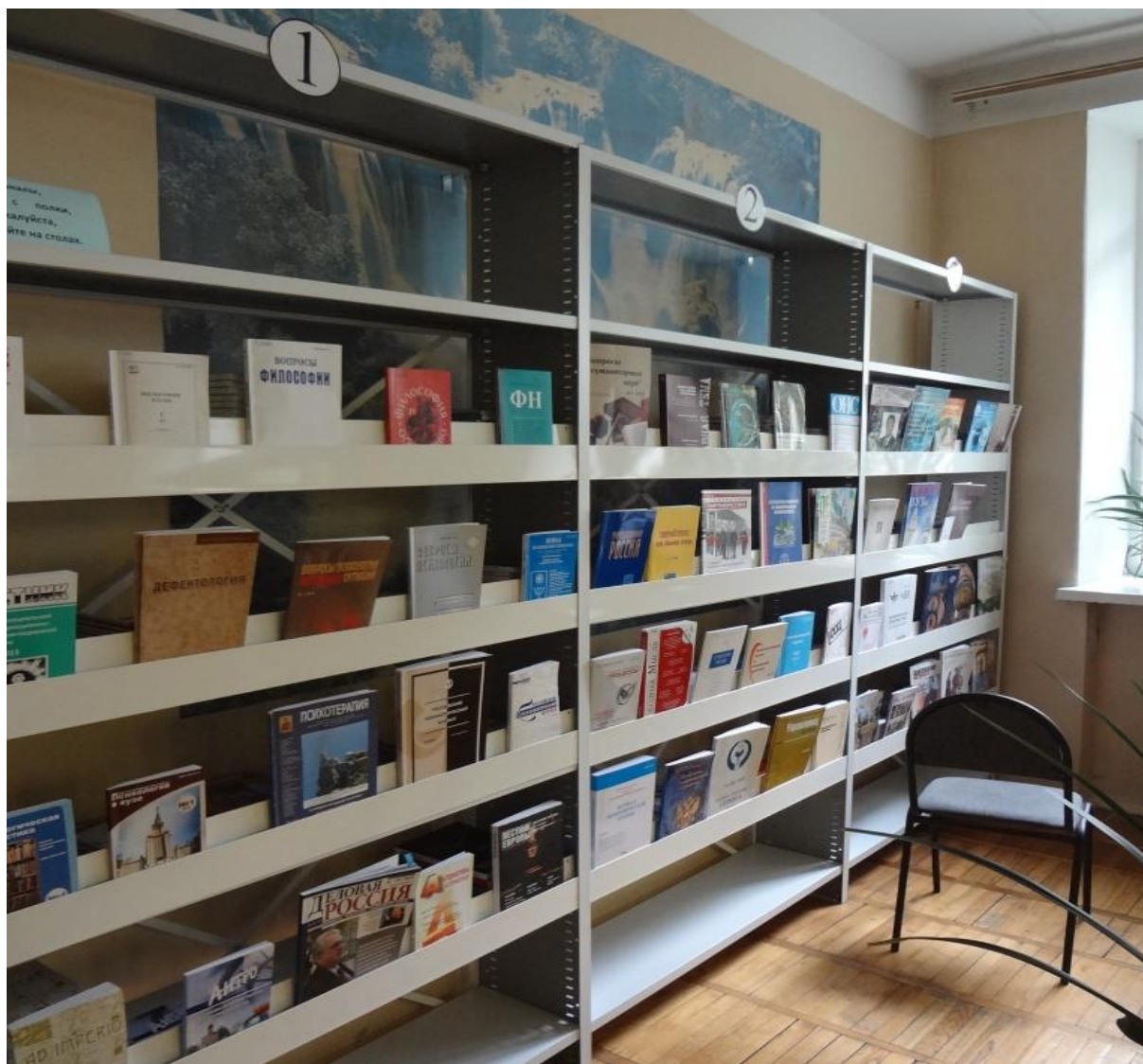
Фото 8. Передняя планка – карман для периодики на стационарных стеллажах серии «СА».