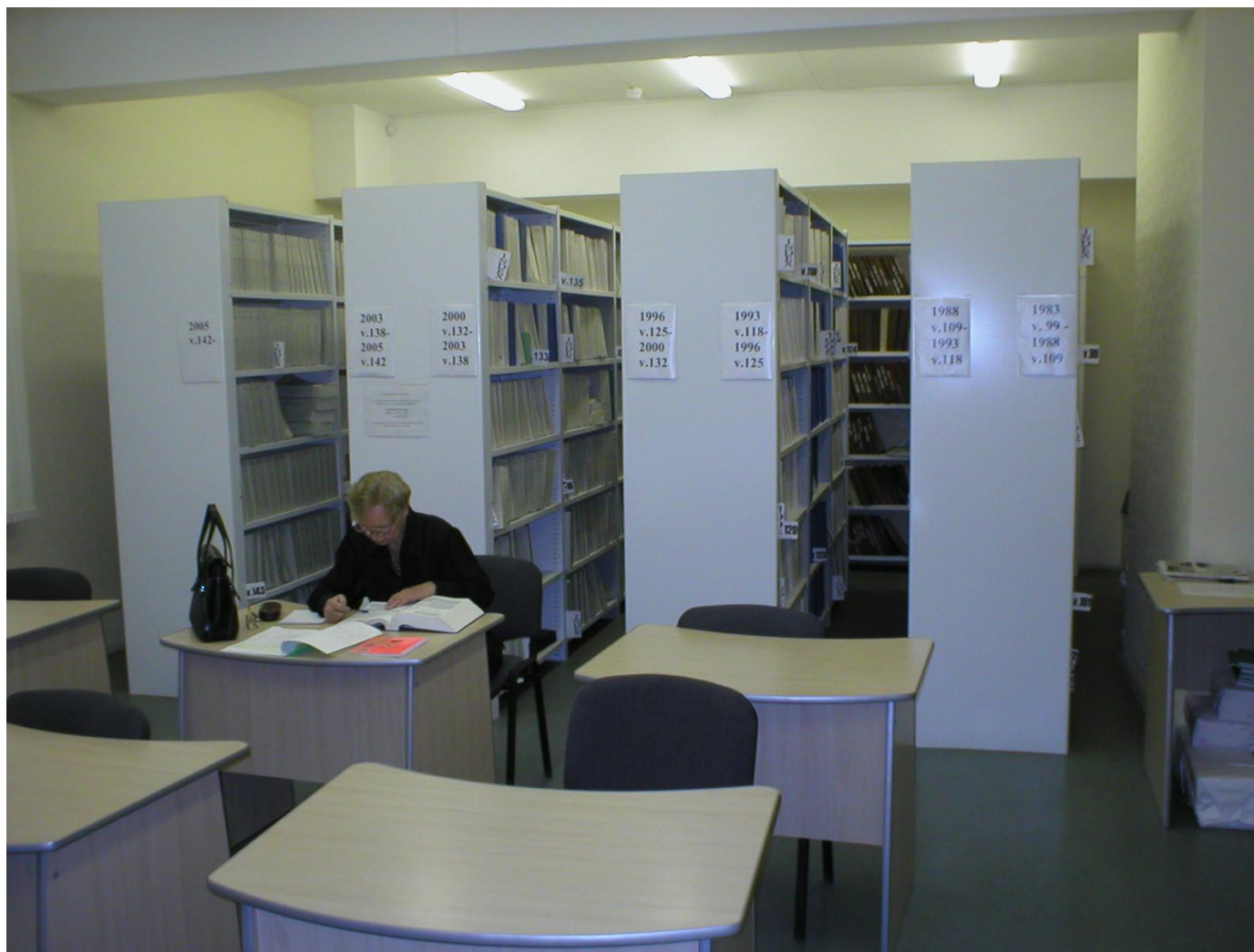
Фото 7. Читальный зал библиотеки предприятия оборудован металлическими стеллажами серии «СА»