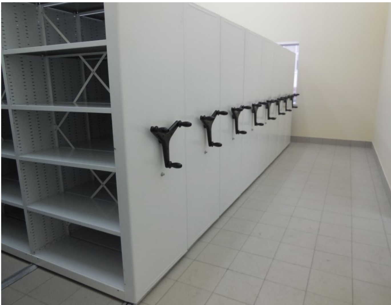
Фото 2 . Передвижные стеллажи без фальшпола. Серия «Л». Самая легкая конструкция. Устанавливается на ровные полы.