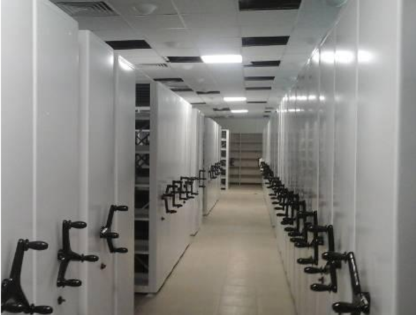
Фото 1 . Передвижные стеллажи занимают всю полезную площадь помещения. Оптимальный вариант для хранилищ централизованных библиотечных систем, крупных библиотек.